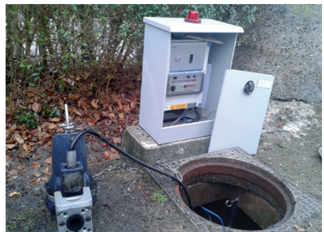
Drukemaal na renovatie

32 Drukrioleringsgemalen in gemeente Heeze-Leende zijn in 2012 volledig door Pleuger gerenoveerd. Bij de uitvoering van dit project zijn de werkzaamheden goed afgestemd met de bewoners om zo de mogelijke overlast tot een minimum te beperken. Naast dit project voert Pleuger ook naar volle tevredenheid het onderhoud uit aan de gemalen in deze gemeente.