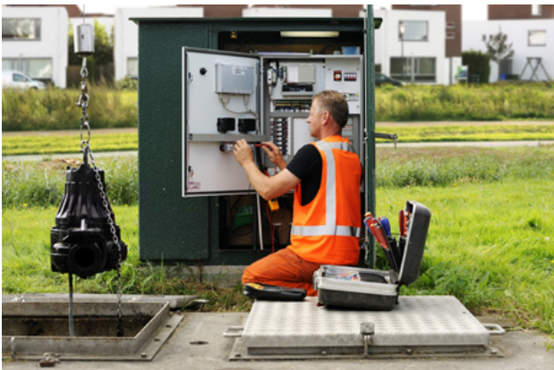
Rioolgemaal gemeente Waalwijk